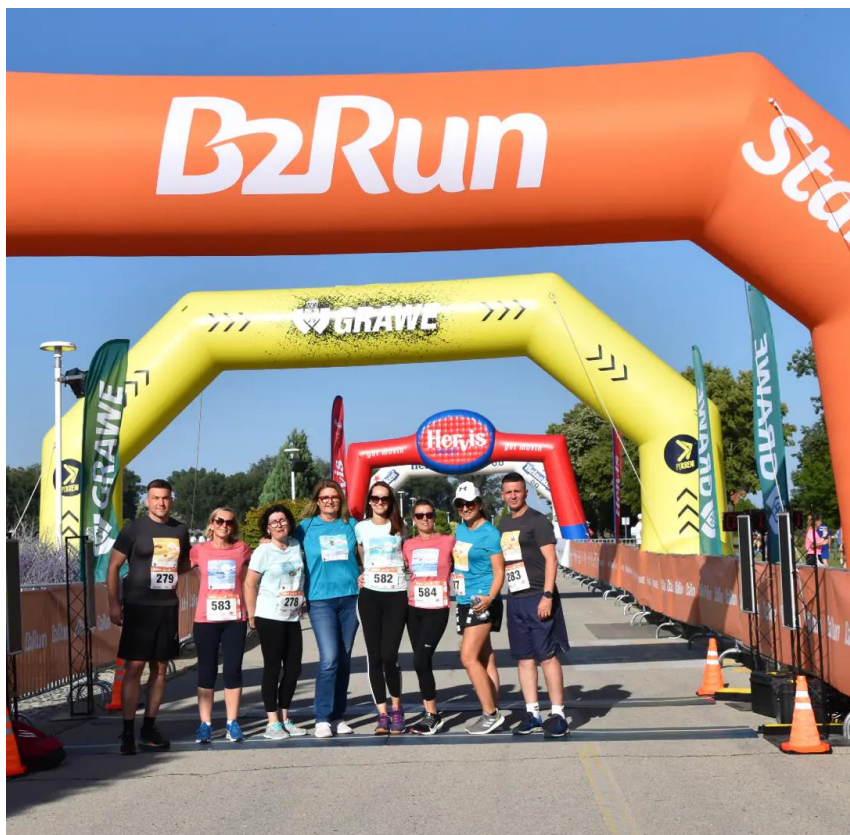
B2Run Osijek, lipanj