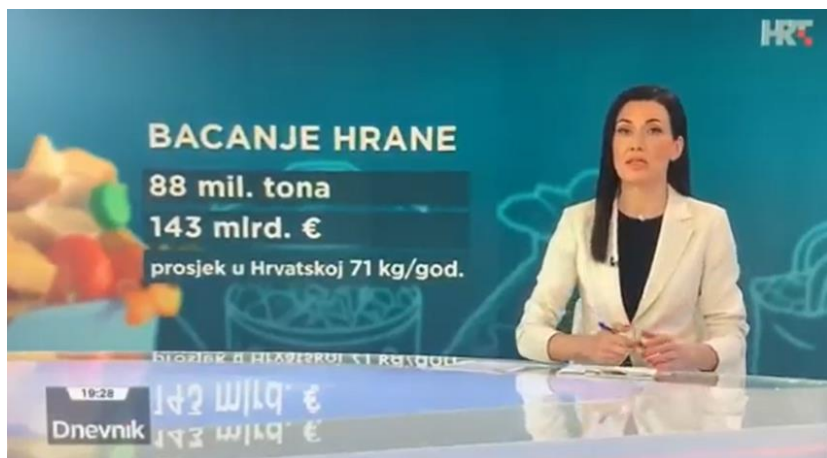
HRT1 - Dnevnik