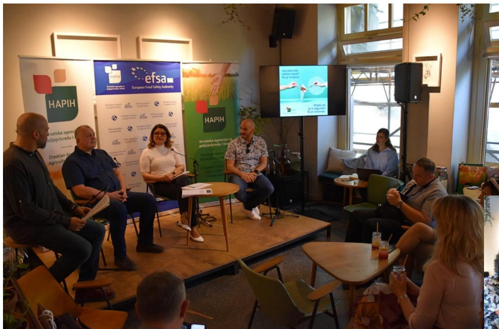
Press brunch – 13. June 2022, Zagreb