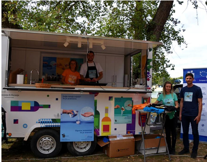
Food Truck festival, Zagreb